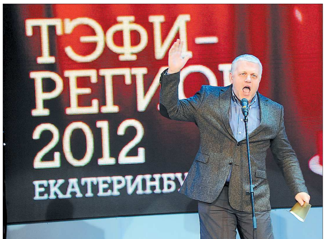
Один из самых известных российских телеакадемиков, член жюри одиннадцатого конкурса регионального телевидения Павел Шеремет (на снимке) пророчит «голубым экранам» долгий век