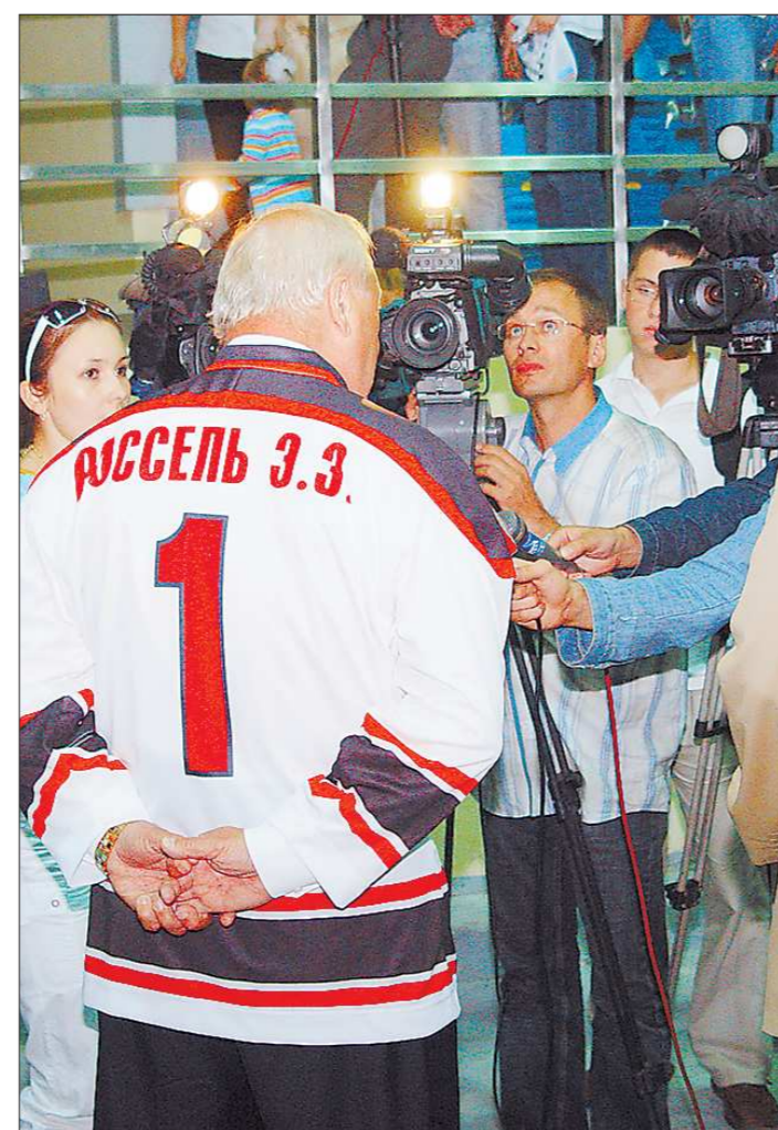
Эдуард Россель был первым номером свердловской политики почти два десятка лет — больше, чем кто-либо другой. В понедельник ему исполняется 75 лет. Накануне своего юбилея первый губернатор области ответил на вопросы «ОГ»