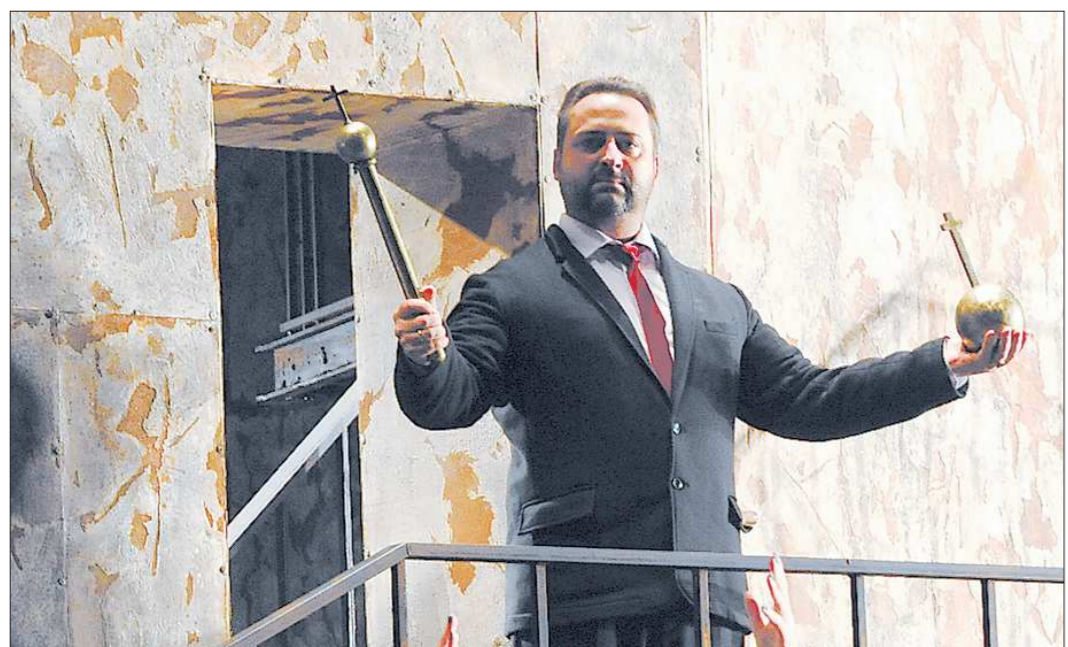
Не поверите: это — Борис Годунов в новой премьер-роле Екатеринбургского оперного. Скипетр и держава — самые светлые пятна в спектакле, насыщенном современными аллюзиями