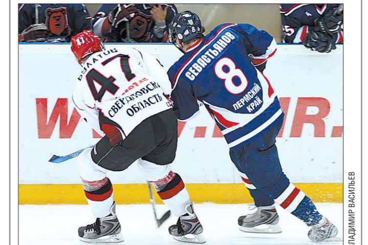
Вопрос «Кто главнее?» два региона выясняют до сих пор. Но сейчас — только на спортивных аренах

ИТОГО. 138 лет Екатеринбург был в подчинении Перми (с 1781-го по 1919-й), затем четыре года эти города были независимыми друг от друга, затем 15 лет Пермь подчинялась Екатеринбург и, наконец, с 1938 до нынешнего времени (74 года) — снова независимы.