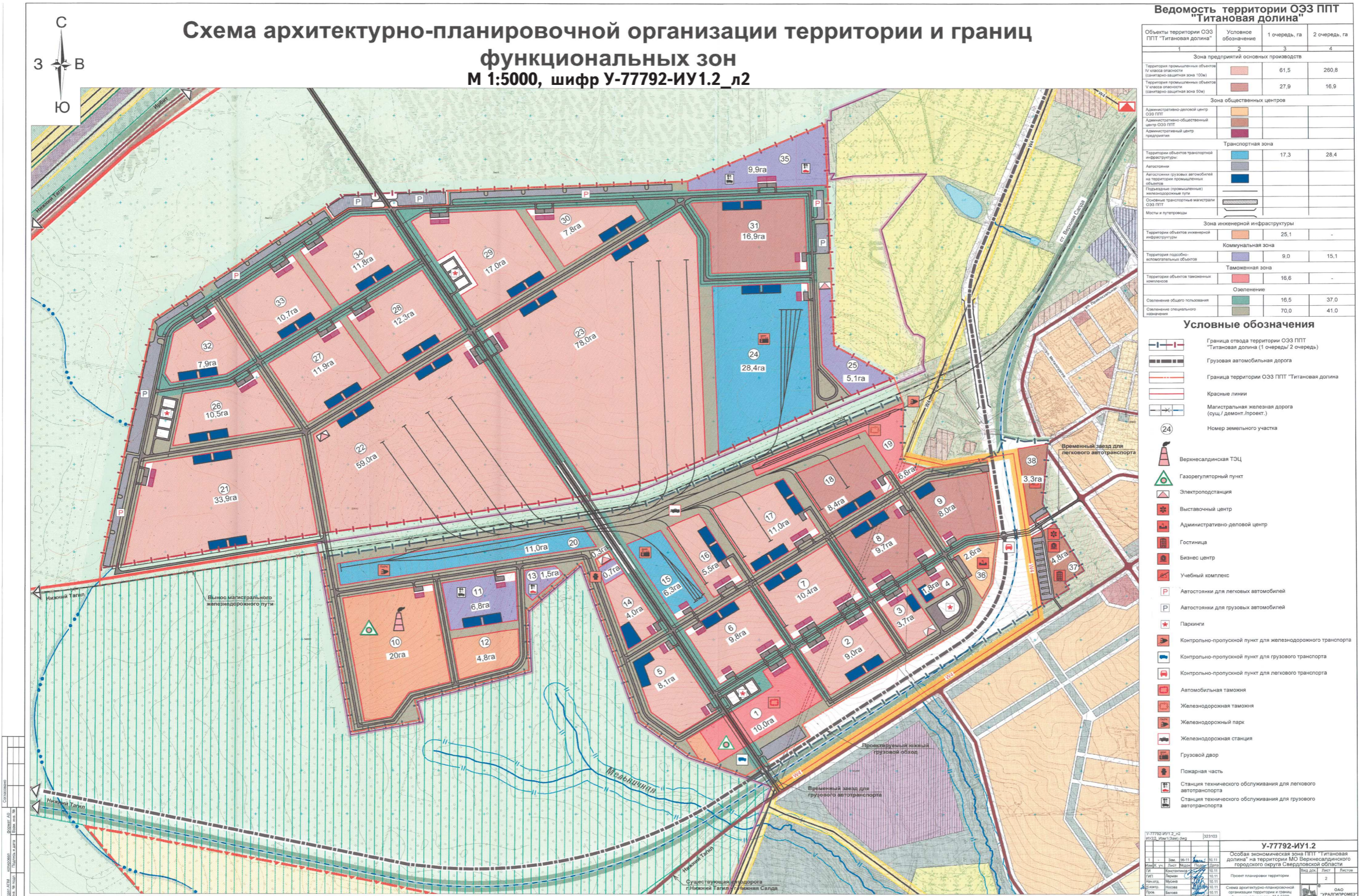
Схема архитектурно-планировочной организации территории и границ функциональных зон М 1:5000, шифр У-77792-ИУ1.2_л2

распоряжением Правительства Свердловской области от 19.09.2012 г. № 1816-РП «Об утверждении основной части проекта планировки особой экономической зоны промышленно-производственного типа «Титановая долина» на территории Верхнесалдинского городского округа Свердловской области и проекта межевания особой экономической зоны промышленно-производственного типа «Титановая долина» на территории Верхнесалдинского городского округа Свердловской области»