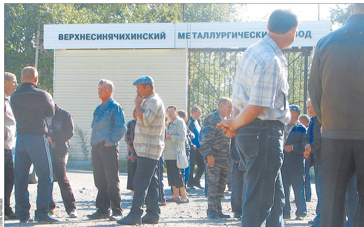
Начавшаяся летом акция протеста получила продолжение