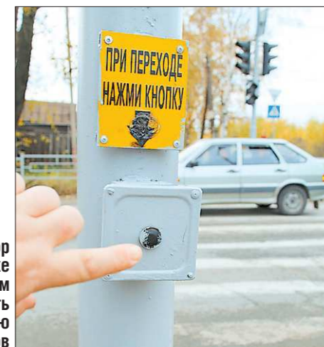
Светофор в посёлке Кирпичном будет работать по требованию пешеходов

Пешеходный переход на перекрёстке улиц Краснознамённой и Полярной посёлка Кирпичный Нижнего Тагила станет безопасным. Местные жители ждут, что новый светофор здесь заработает со дня на день.