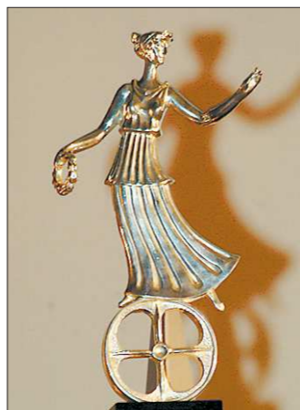
Так выглядят официальные призы фестиваля

Жюри XXIII фестиваля возглавит заслуженный ар-