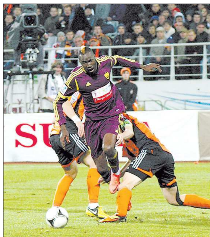
Футболисты «Анжи» хоть и с трудом, но всё-таки сумели пройти сквозь уральское «ушко» в следующую стадию Кубка России

Дорогие ветераны, уважаемые пенсионеры, низкий поклон всем вам за труд, мудрость и опыт, за реальную помощь в воспитании молодёжи! Искренне желаю вам доброго здоровья, хорошего настроения, активного долголетия, семейного тепла и благополучия!