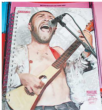
Интересы молодёжи иллюстрируют тетради, которые продаются сегодня в магазинах.

Тетрадки с какими изображениями вызывают у педагогов негативную реакцию?