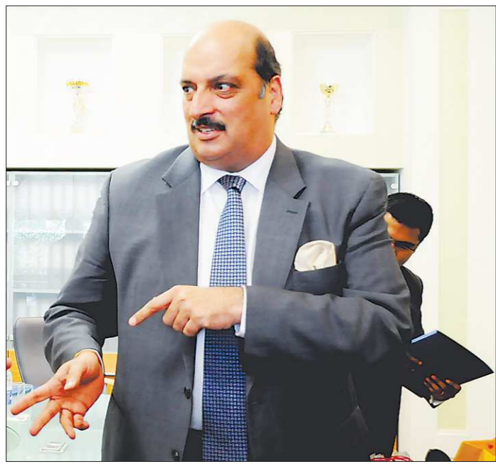
Инди́йский посол признался, что ни ему, ни его согражданам уральские холода не страшны