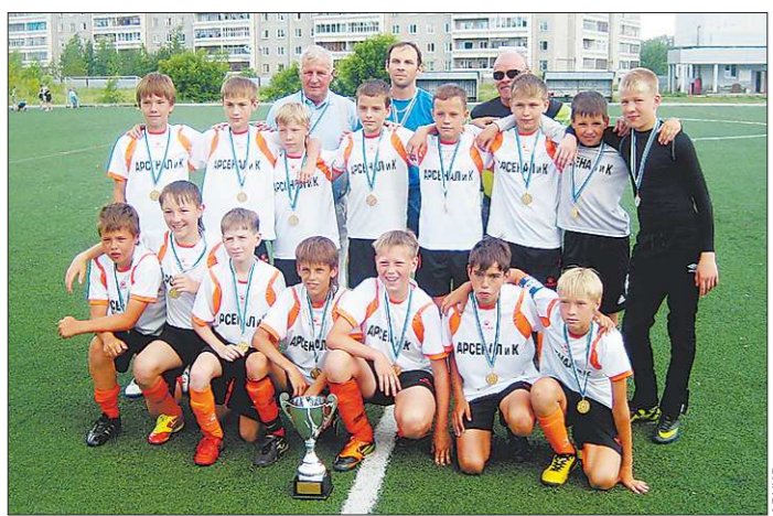
Золотой состав берёзовского «Арсенала и К»

Впереди у ребят — Международный турнир «Кожаный мяч», который будет проводиться в Сочи уже этой осенью. Кто будет их соперниками, ребята ещё не знают, но сразу после награждения побежали тренироваться. Нужно быть готовыми к любому сопернику.