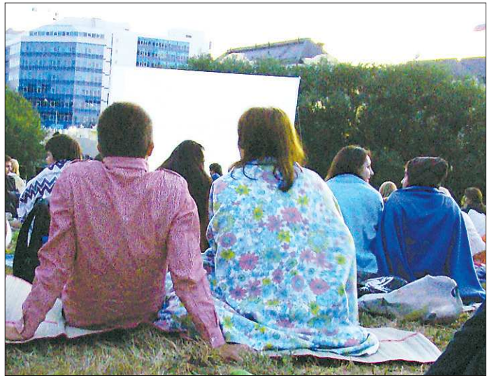
Чтобы зрители не мерзли холодными вечерами, организаторы принесли им теплые пледы, которые, увы, не всегда возвращали