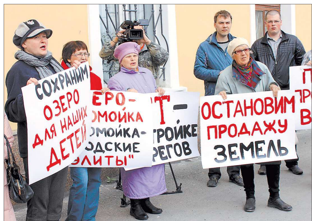
Весной 2012 года в Среднеуральске прошла череда митингов в защиту берега Исетского озера

Следующая остановка — возле выставочного образца российского беспилотника. Здесь Дмитрий Rogozin задержался надолго. Новинка объединённой промышленной корпорации «Оборонпром» — настоящее ноу-хау отечественной науки, мечта военных и сотрудников многих ведомств.