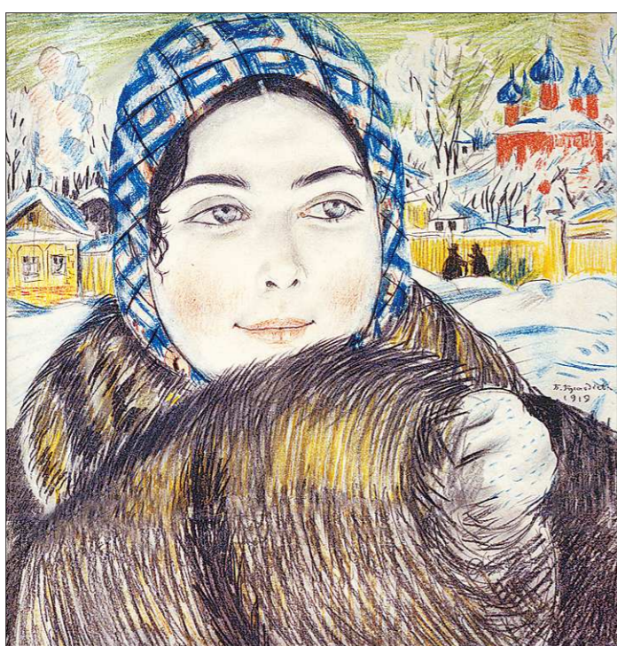
Борис Кустодиев. «Молодая купчиха в клетчатом платочке»

Это одна из высших точек в развитии отечественной графики. Не случайно, наверное, каждый хоть однажды