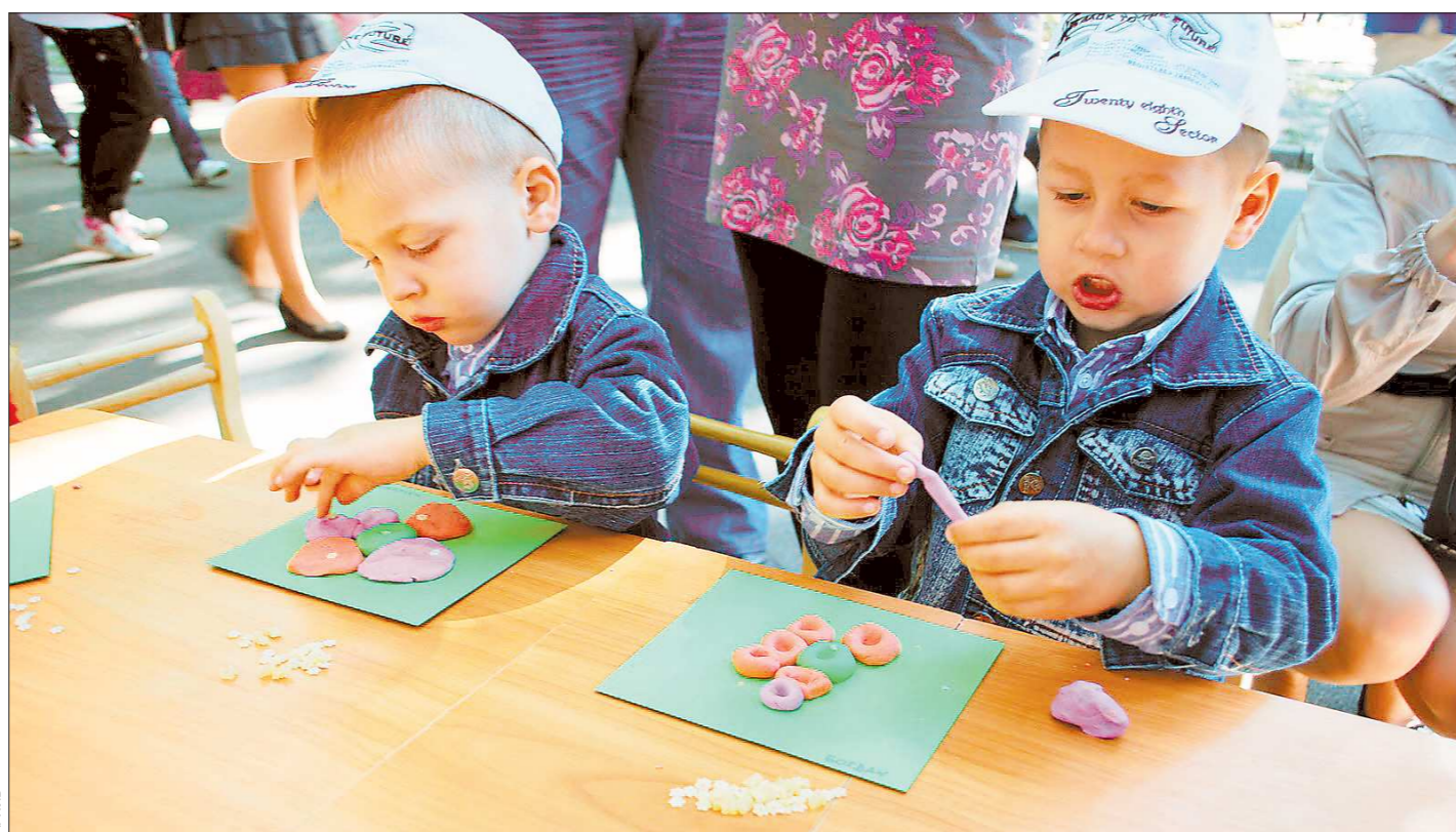
А учиться никогда не рано

Глава Среднего Урала обсудил с председателем регионального правительства и такую важную тему, как подготовка школ к новому учебному году. На эти цели из казны региона направлено порядка 1,5 миллиарда рублей. Денис Паслер сообщил, что около 98 процентов учебных заведений области уже готовы открыть двери для учеников. Осталь-