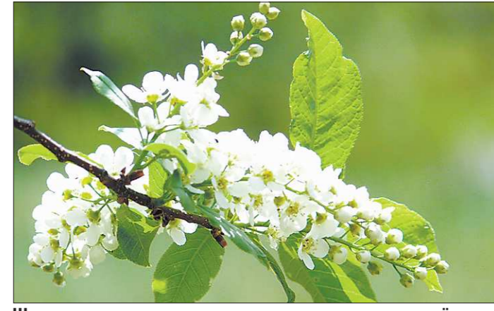
Шалинские старожилы не смогли припомнить, когда ещё в местных краях по второму разу цвела черёмуха