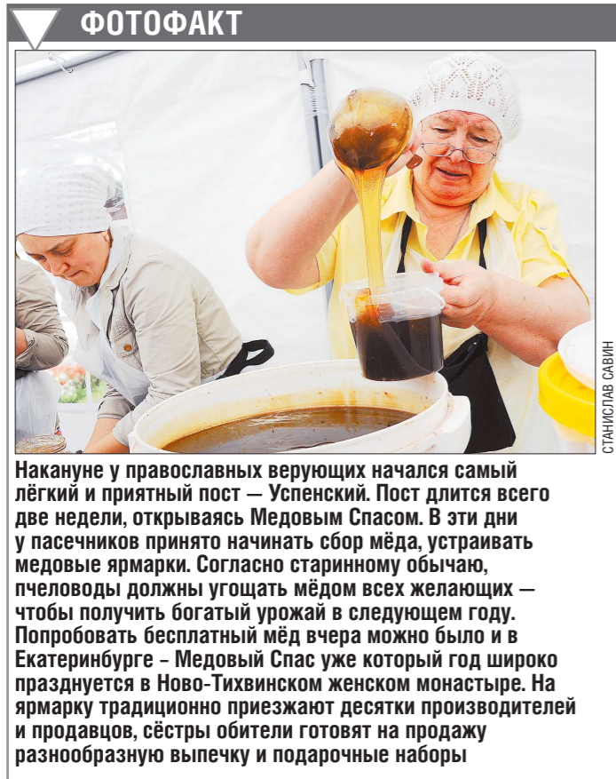
ФОТОФАКТ Накануне у православных верующих начался самый лёгкий и приятный пост — Успенский. Пост длится всего две недели, открываясь Медовым Спасом. В эти дни у пасечников принято начинать сбор мёда, устраивать медовые ярмарки. Согласно старинному обычаю, пчеловоды должны угощать мёдом всех желающих — чтобы получить богатый урожай в следующем году. Попробовать бесплатный мёд вчера можно было и в Екатеринбурге — Медовый Спас уже который год широко празднуется в Ново-Тихвинском женском монастыре. На ярмарку традиционно приезжают десятки производителей и продавцов, сёстры обители готовят на продажу разнообразную выпечку и подарочные наборы