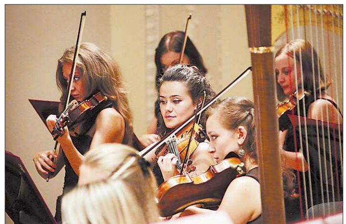
На поездку уральского молодёжного симфонического оркестра в Берлин скинулись более 500 любителей музыки