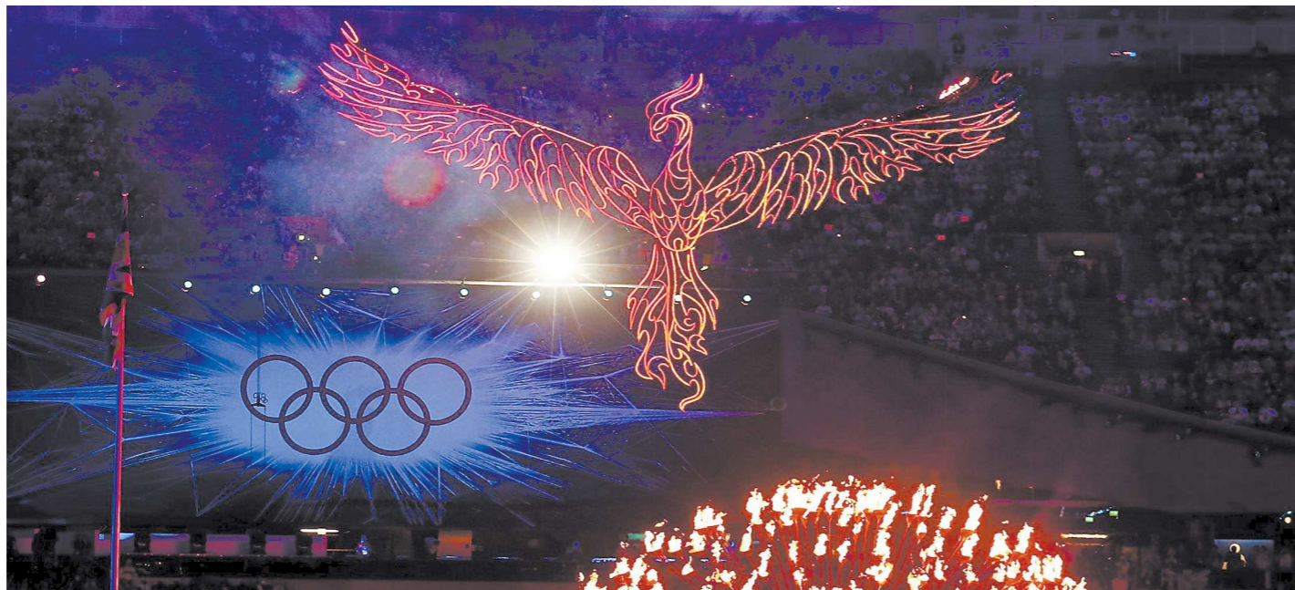
Один из самых запоминающихся моментов закрытия Олимпиады-2012 – бессмертная птица Феникс, вылетающая из олимпийского огня, который вот-вот должен погаснуть. Через четыре года её свет озарит Рио-де-Жанейро