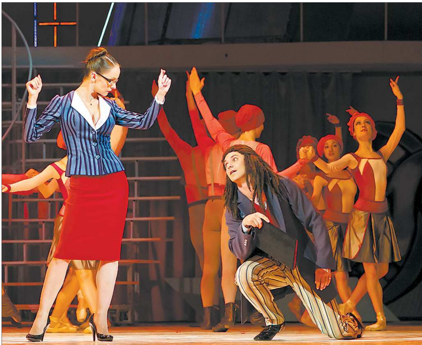
Герои «Amore buffo» танцуют на пуантах и... на каблучках. Тупфли на каблучках – прецедент на академической сцене. Эпатаж? Нет, сам замысел – современный сюжет, современные герои – оправдывает эту неожиданную новацию. От участников «Dance-платформы» ждут того же: ярких, неожиданных, но оправданных идей сценических решений

Но сами-то хореографы ниоткуда не возникают. Они должны ставить, экспериментировать. Участникам хореографических мастерских я всё время повторяю: «Не пытайтесь создать бессмертное. Делайте, как чувствуете. Учитесь, совершайте ошибки». Это нормальный процесс. Тем более что у современной хореографии, образно говоря, – вообще, «прищавый период». Подростковый. – Мэтр отечественной хореографии Борис Эйфман заявил недавно, что «престиж России как балетной державы под угрозой». По его мнению, затраты государства на обучение артистов, хореографов не оправдываются. Сколько хореографов мы узнали за по-