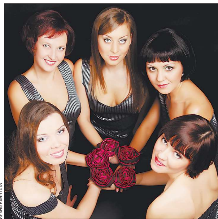
Каждый цветок проявит свою настоящую красоту, если правильно составить букет

Послушав и посмотрев «Fleurs-De-Lys», многие убедятся, что музыка – это энергия. Кроме интересного вокала, наполненного, мастерски сделанного, квинтет отличает особый артистизм – свободный, естественный, деликатный, существующий в унисон с музыкой. Он – из оперно-театрального прошлого, которое есть у всех. «Человек поёт всем телом. Мы