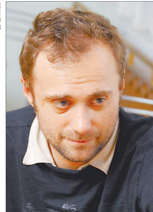
Вячеслав Самодуров, выпускник Академии русского балета им. Вагановой, начал блестящую карьеру танцовщика в Мариинском театре. В 2003-м стал премьером Королевского балета Ковент-Гарден и там же в 2010-м поставил свой первый спектакль

Екатеринбург давно признан танцевальной столицей России: феномен – в том, что в отдельно взятом городе возникли и плодотворно работают несколько данс-коллективов, ставших сегодня брендом в жанре современного танца. Не случайно именно в Екатеринбурге родился и каждый раз со-