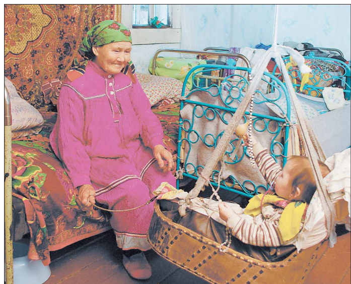
Самые известные мансийские посёлки – это Саран-Пауль, Ушма, Вижай, Тохта, Бурмантово и Хорпия. А самые известные мансийские фамилии – Бахтияров, Куриков, Анямов, Хандыбин, Пакин, Санбиндалов