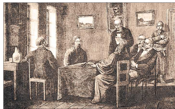
Гравюра начала 80-х годов XIX века «Заседание земской уездной управы»