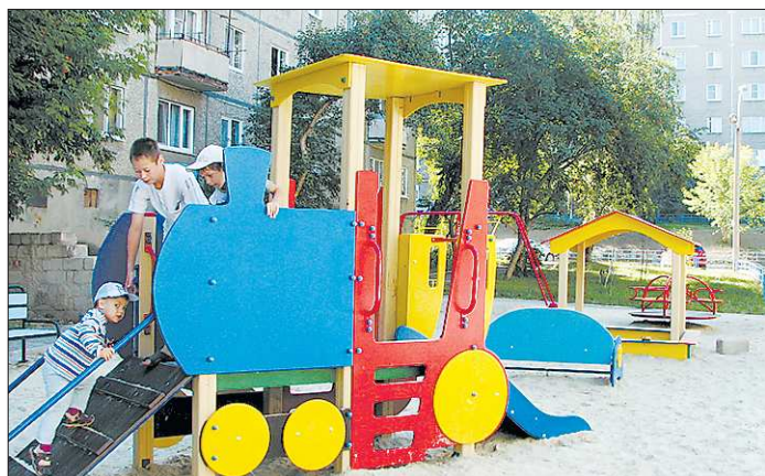
Юные жители улицы Газетная раньше играли на территории детского сада. Теперь у них три площадки для радости и здорового развития