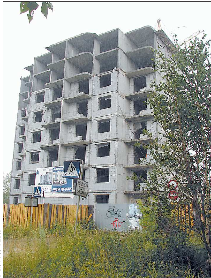
Памятник тому времени, когда в Асбесте строили многоэтажки