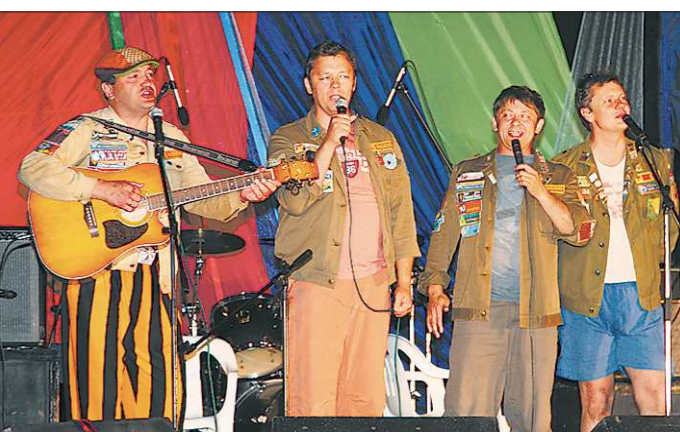
2010 год. Все участники команды КВН «Уральские пельмени» – бойцы студенческих отрядов «Мечта», «Ассоль», «Здесьвейс»...