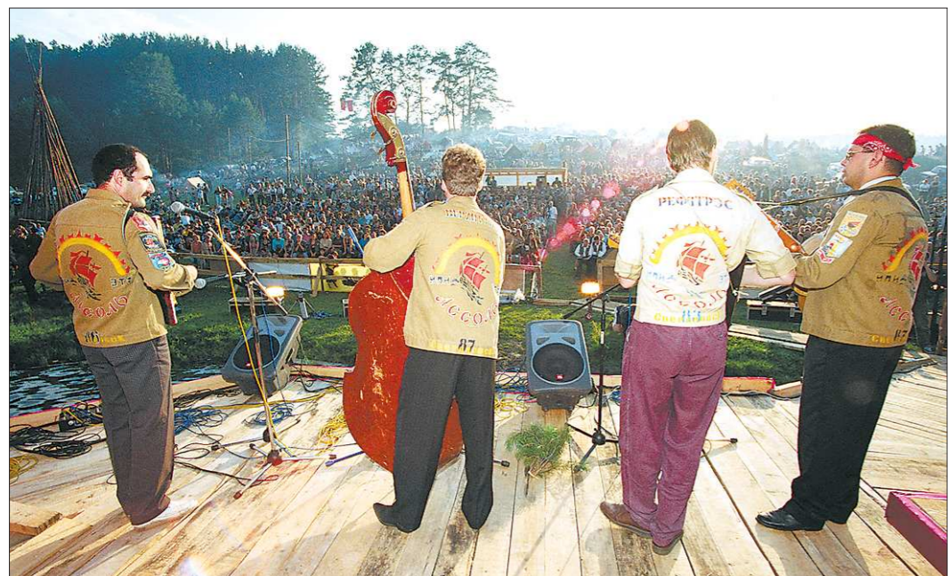
«Банда» «старичков» зажигает не по-детски