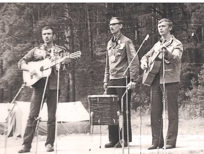
1983 год. ССО «Мечта» бывшего УГТУ-УПИ существовал около 40 лет. Сегодня в объединённом УрФУ такого отряда нет, но его песни до сих пор поются на фестивале