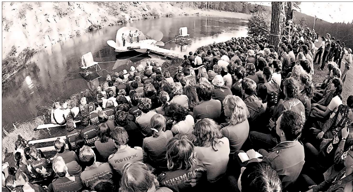
1985 год. В середине 80-х фестиваль собирал 400-500 человек. Сегодня более 20-ти тысяч

Первый фестиваль прошёл в Доме культуры села Знаменское Сухоложского го-