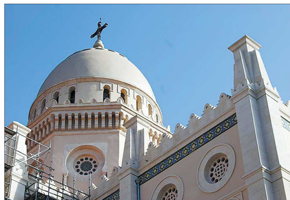
Редкий кадр в мусульманской стране

подкидало ощущение в чём-то замершей жизни, хотя Аннаба считается самым европейским городом страны.