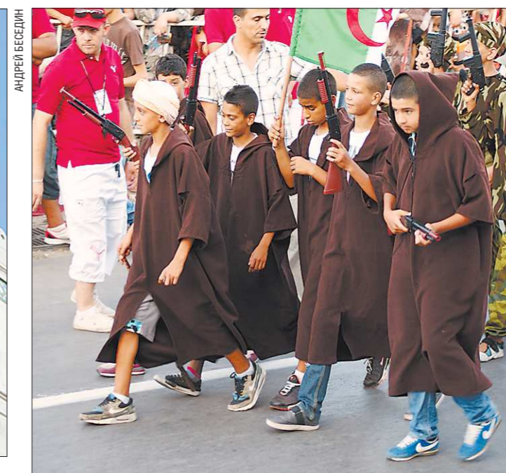
О семилетней борьбе за независимость эти ребята знают только понаслышке

Алжирская Народная Демократическая Республика Государство в Северной Африке в западной части Средиземноморского бассейна, крупнейшее по территории африканское государство. Столица - город Алжир. На севере Алжира параллельно друг другу тянутся хребты Атласа - Тель-Атлас и Сахарский Атлас. На узкой полосе побережья и в предгорьях Тель-Атласа проживает 93 процента населения страны. Недра Алжира богаты нефтью, газом, рудами чёрных и цветных металлов, марганцем, фосфоритом. Основа экономики Алжира - газ и нефть. Они дают 30 процентов ВВП, 60 процентов доходной части госбюджета, 95 процентов экспортной выручки. По запасам газа Алжир занимает 8-е место в мире и 4-е место по его экспорту. По запасам нефти Алжир на 15-м месте в мире и на 11-м месте по её экспорту. Численность населения - 34,9 миллиона человек (2009 год). Городское население - 65 процентов. Этнический состав - арабы (83 процента), берберы (16 процентов), прочие менее одного процента. Язык - арабский (официальный), берберские диалекты, распространён французский. Религия - мусульмане-сунниты 99 процентов, прочие один процент.