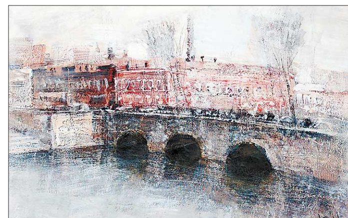
Один из живописных мостов Екатеринбурга

В пейзажах Первушина, делящим свою любовь между Екатеринбургом и Петербургом, привлекает атмосфера, в натюрмортах — незримость. Излюбленный цвет — белый, в сложных и простых оттенках и сочетаниях: стужкой уложенное сливочное масло, взбитый ветром снег, сморщенный папирус, молоко, в которое нечаянно попало кофе. И за обманчивой лёгкостью цвета вдруг возникает нелинейная сложность привычных вещей. Серебряная ложка, серебристое яблоко, посеребрённый мост — простота в обыденном. Главное — увидеть её. И когда «просто» оказывается непросто, не простым, а сложным, это завораживает.