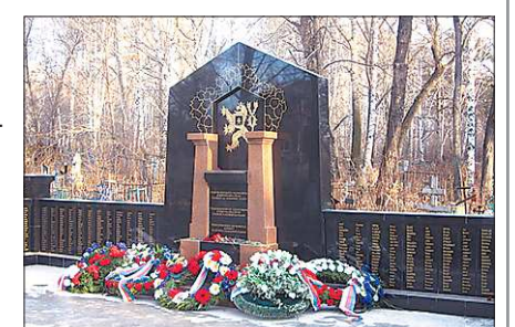
В Екатеринбурге находится самое крупное в России захоронение чехословацких legionеров. На Михайловском кладбище покоятся 360 человек. В 2008 году здесь по инициативе Чехии был установлен памятник

КСТАТИ. Штаб командующего чехословацкими войсками генерала Радолы Гайды располагался в доме Ипатьева, в подвале которого буквально за неделю до этого расстреляли семью Николая II.