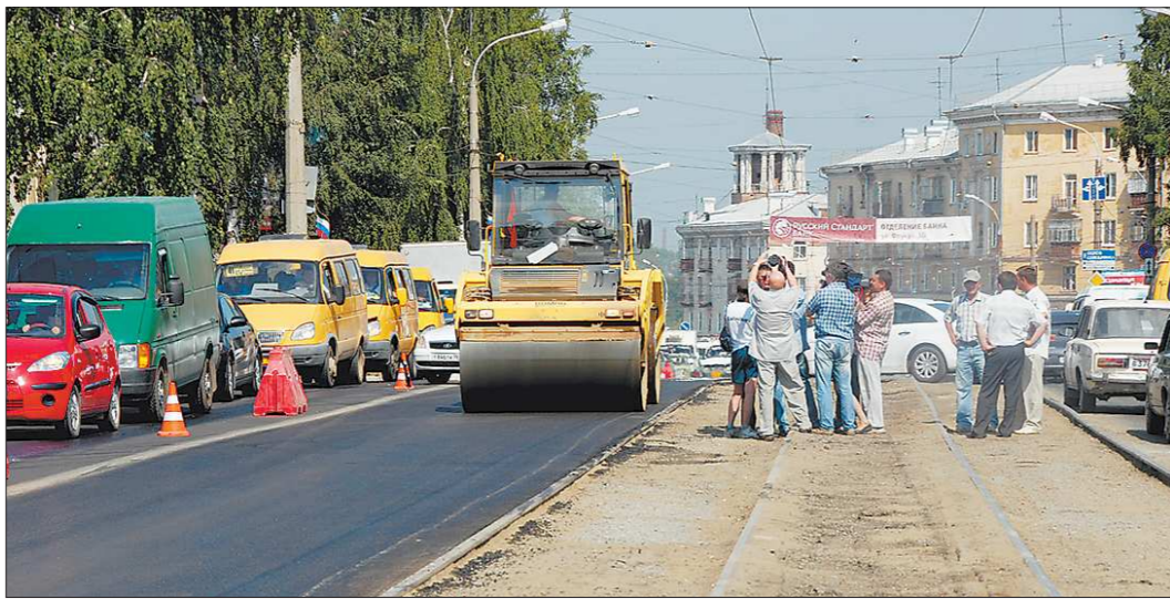
Дороги города — лишь одна из проблем, решение которых нуждается в лучшей организации