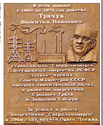
Екатеринбург, пр. Ленина, 38

А после войны правительство страны приняло развёрнутую программу развития энерге-