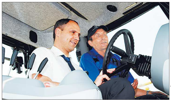
За штурвалом многотонного трактора областной премьер чувствовал себя уверенно