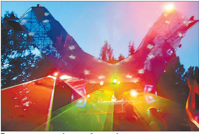
Первые раскаты цифрового баса на фоне заходящего солнца