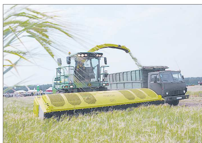
Этот американский комбайн — новичок наших показов техники, но сразу привлек к себе внимание сельян

лучших производителей по всему миру. Стоит такая техника дорого. Например, трёхроторный «Версатайл», за штурвалом которого областной премьер