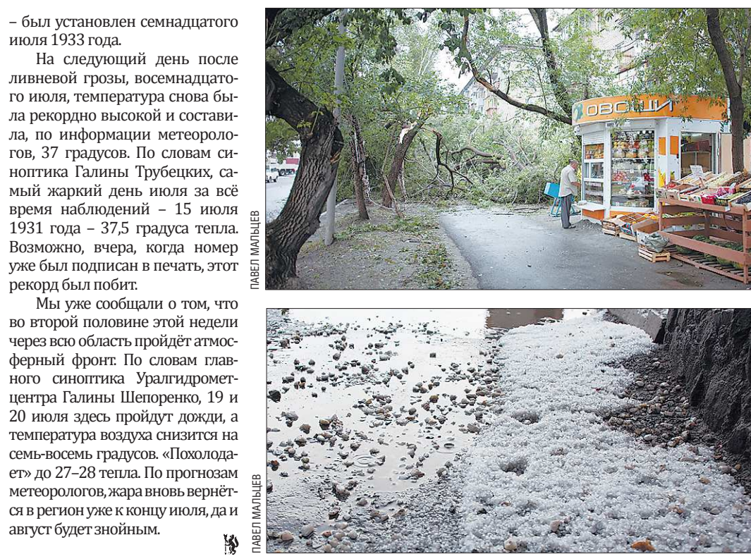
— был установлен семнадцатого июля 1933 года.

Уральские синоптики ведут наблюдения за погодой с 1836 года. Согласно их данным, минувший вторник стал самым тёплым семнадцатым июля за 176 лет. В этот день термометр показывал 34,2 градуса со знаком плюс. Предыдущий температурный рекорд — 33,3 градуса тепла