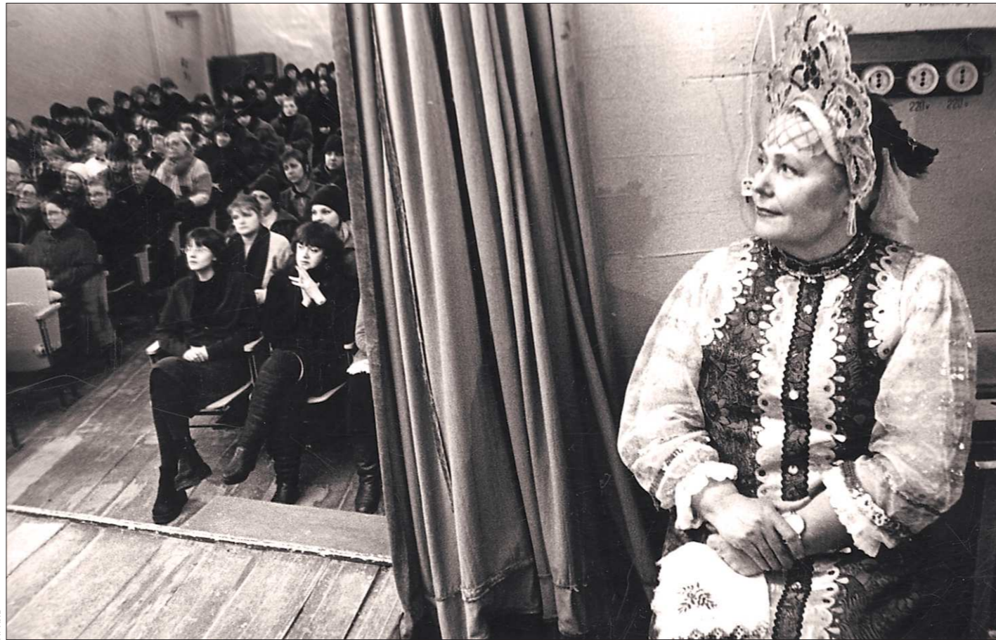
Конец 1990-х. Концерт в женской колонии. Более внимательных зрителей сложно представить и сегодня. Для заключённых выступления артистов не только развлечение, но и образование