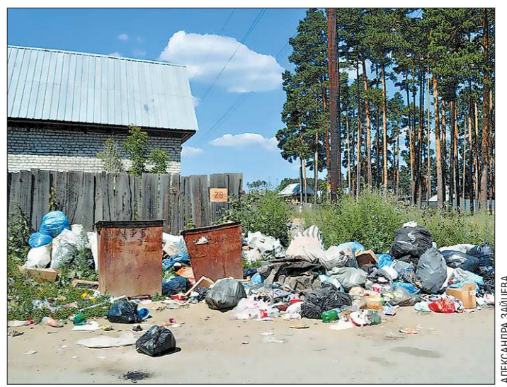
Контейнеры стоят пустые. Зато вокруг мусора предостаточно

УЧРЕДИТЕЛИ И ИЗДАТЕЛИ: Губернатор Свердловской области, Законодательное Собрание Свердловской области. Адрес: 620031, г. Екатеринбург, пл. Октябрьская, 1