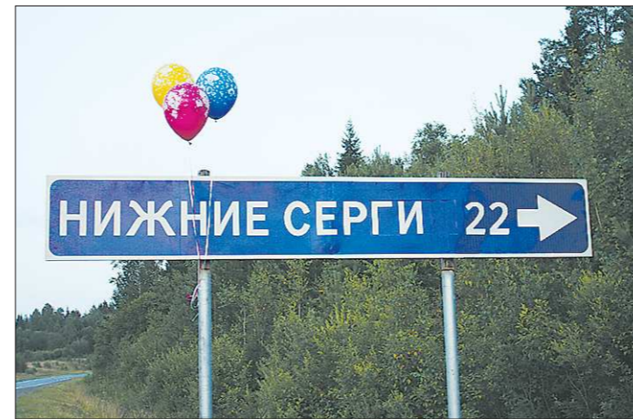
Меньше чем через месяц после публикации в «ОГ» дорожники избили «Нижние Серги» от лишнего мягкого знака. «Серги» висели над федеральной трассой Пермь-Екатеринбург в течение нескольких лет

одном из таких примеров мы писали еще 15 мая («Без полѳта Григория Бахчиванджи, может быть, не было бы и апреля 1961 года»); на памятном знаке в посѳлке Кольцово, кроме исторической неточности, с