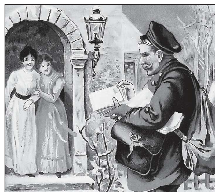
Письмечко в конверте ожидаемо во все времена

Характерный факт в истории Верхней Пышмы: до 1993 года положение о почётном гражданине Верхней Пышмы оставалось неизменным на протяжении двадцати лет. Активные манипуляции с этим статусом начались в начале 1990-х годов, с появлением рыночной экономики, когда соблазнов в обществе стало намного больше.