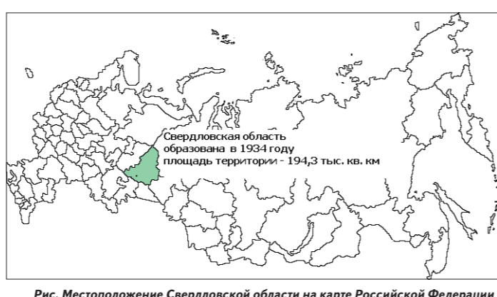
Рис. Местоположение Свердловской области на карте Российской Федерации

Глава 1. Экономико-географическое положение Свердловская область — крупная экономически развитая территория России с высоким уровнем деловой, культурной и общественной активности, один из наиболее перспективных субъектов Российской Федерации. Область находится на границе двух географических и экономических зон России — европейской и азиатской. Протяженность территории с запада на восток — около 560 км, с севера на юг — около 660 км. Площадь территории составляет 194,3 тыс. кв. км. Через область проходит транзитно-транспортные пути, которые идут из западной части России в азиатские районы, а также пересекают область в меридиональном направлении — с севера на юг.