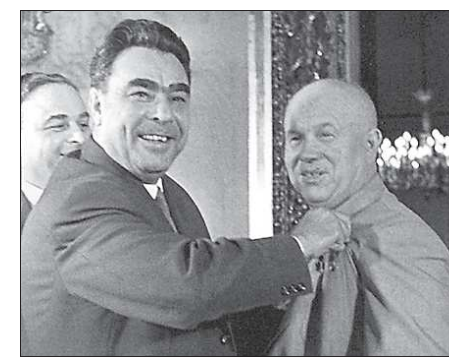
События 13-14 октября 1964 года – классика дворцовых переворотов. Раздражавший всех своей непредсказуемостью Никита Хрущёв был обложен со всех сторон: на стороне Леонида Брежнева – армия, спецслужбы, союзная и региональная партийные элиты. Первому секретарю ЦК оставалось лишь подписать прошение об отставке