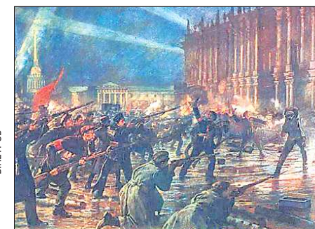
Восстание 25-26 октября 1917 года в Петрограде сами большевики долгое время именовали октябрьским переворотом. Вооружённый мятеж, начавшийся с захвата мостов, вокзалов и телеграфа, закончился штурмом Зимнего дворца и арестом Временного правительства. «Триумфальное шествие советской власти» очень скоро переросло в кровопролитную Гражданскую войну