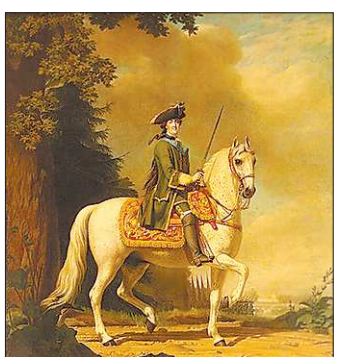
Это один из любимых портретов императрицы Екатерины. В мундире офицера Преображенского полка она возглавила поход против свергнутого с престола супруга

вести императрицу в город. Вот восторженный народ несёт её через площадь «высоко над головами» к Зимнему дворцу, куда уже прибыла Екатерина. Вот дальновидная подруга растолковывает императрице, что нельзя допустить приезда её супруга в столицу. Затем две главные дамы «революции» облачаются в мундиры гвардейцев и во главе войска направляются в поход против свергнутого императора. Интересно, как выглядели бы воспоминания братьев Орловых, реши они подробно описать те события?