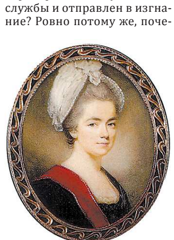
В девятнадцать лет Екатерина Дашкова вошла в историю, оказав неординарные услуги Екатерине в её борьбе за власть. В тридцать девять – стала первой в мире женщиной, возглавившей Академию наук

Почему активный участник возведения на престол Елизаветы Петровны Иоганн Лесток спустя семь лет был арестован, а затем оказался в ссылке? Почему организатор убийства Павла I Пётр Пален сразу же после переворота был уволен от службы и отправлен в изгнание? Ровно потому же, почему