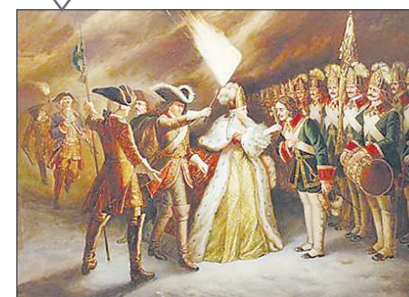
25 ноября 1741 года Елизавета Петровна свергла непопулярное правительство Анны Леопольдовны (матери годовалого императора Иоанна Антоновича). На рисунке – Преображенский полк присягает цесаревне Елизавете. По свидетельству очевидцев, гвардейцы буквально внесли дочь Петра I в Зимний дворец