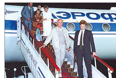
Августовский путч 1991 года начался как типичный дворцовый переворот. Заговорщики не учли одного: вкушавшие политический свобод москвичи вышли на защиту Белого дома. Провал заговора означал переворот «наоборот»: произошёл мгновенный демонтаж прежней политической системы