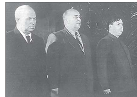
Арест Лаврентия Берия 26 июня 1953 года чем-то напоминает свержение всевысшего регента Эрнста Бирона 8 ноября 1740 года. Правда, Бирон продержался после смерти императрицы Анны Иоанновны лишь три недели, а могущественный шеф МВД наводил ужас на соратников после смерти Сталина более трёх месяцев. Как Бирон не ждал подхода от фельдмаршала Миниха, так и Берия не считал Хрущёва и Маленкова опасными политическими конкурентами...