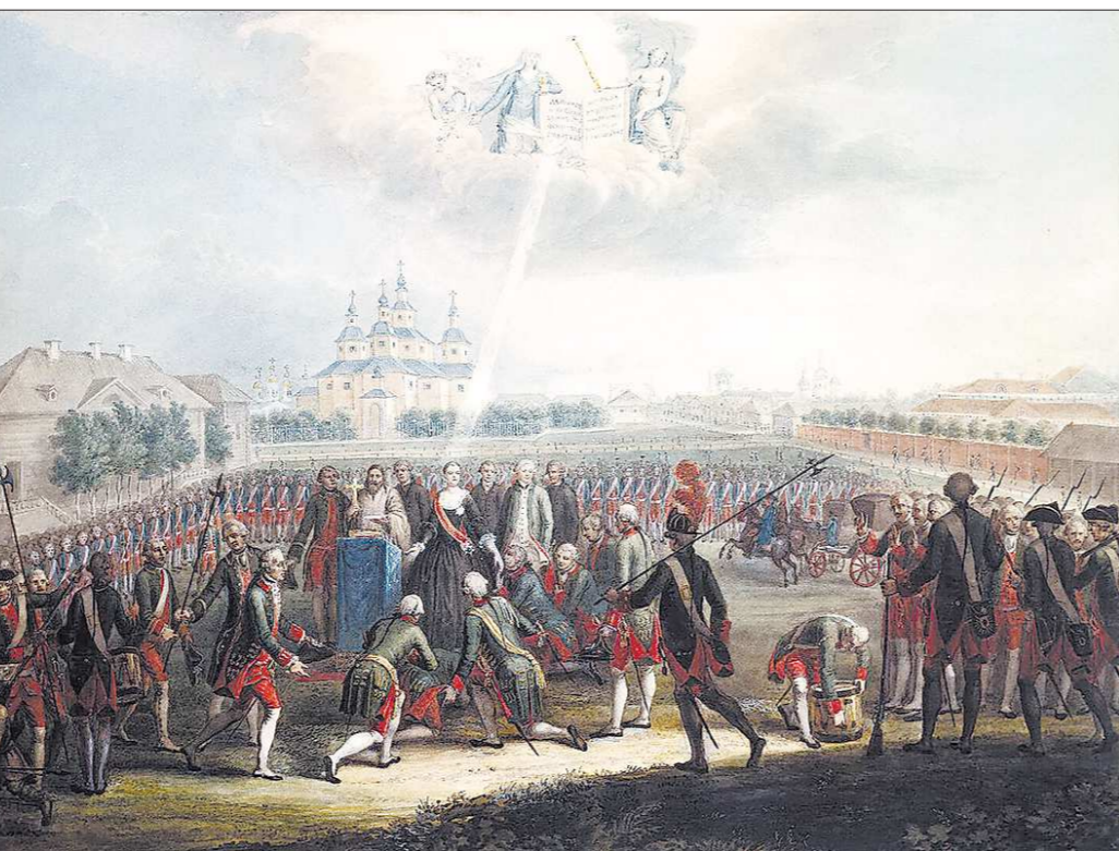
Утром 28 июня (9 июля) 1762 года Екатерина прибыла в Измайловский полк, который присягнул ей как самодержавной российской государыне. Отсюда начался триумфальный путь Екатерины в Зимний дворец

«Ты дура! — кричит разъярённый Пётр. — При каждом дворе должен быть свой клоун, не правда ли? — не теряет присутствия духа Екатерина. «Исторический» диалог, состоявшийся 9 июня 1762 года, в фильме передан достаточно точно, если не считать, что вместо последней фразы императрица просто расплакалась... Назавтра о нанесённом ей оскорблении говорил весь Петербург. А спустя 19 дней столица присягнула новой государыне.