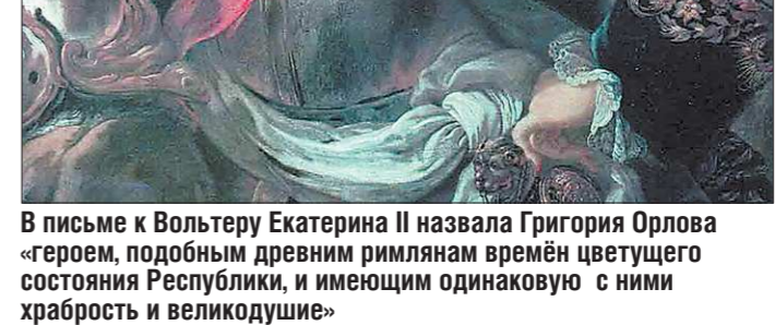
В письме к Вольтеру Екатерина II назвала Григория Орлова «героем, подобным древним римлянам времён цветущего состояния Республики, и имеющим одинаковую с ними храбрость и великодушие»

Если изучать «дамскую революцию» по запискам Екатерины Дашковой, то именно она может показать главную движущую силу переворота. Вот вечером 27 июня Дашкова требует от Алексея Орлова «стрелой мчаться в Петергоф» и