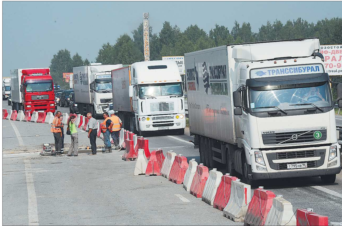
По словам мастера, ремонт идёт по графику: рабочие трудятся до семи вечера и намерены приводить дорогу в порядок даже в выходные

В конце июня депутаты Думы Заречного приняли решение о ликвидации муниципальной аптеки «Вита-Фарм». Чтобы льготники не остались без лекарств, на конкурсной основе заключены договоры с частными аптеками.