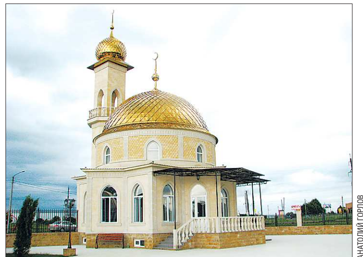
В каждом памятном для ингушей месте, будь то родовое кладбище или мемориальное захоронение, построена небольшая мечеть