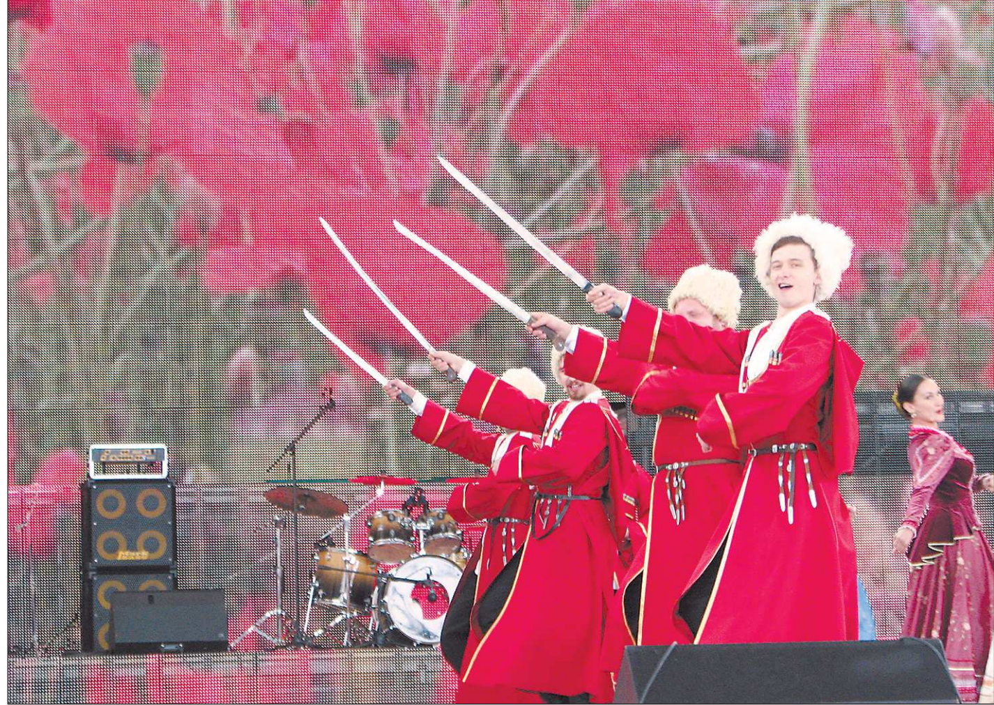
Поздравить соседей-ингушей с днём рождения республики приехали казаки-кубанцы

- Депутаты Законодательного Собрания обрадовались, что и наш земляк тоже Юнус-Бек Евкуров был назначен гла-