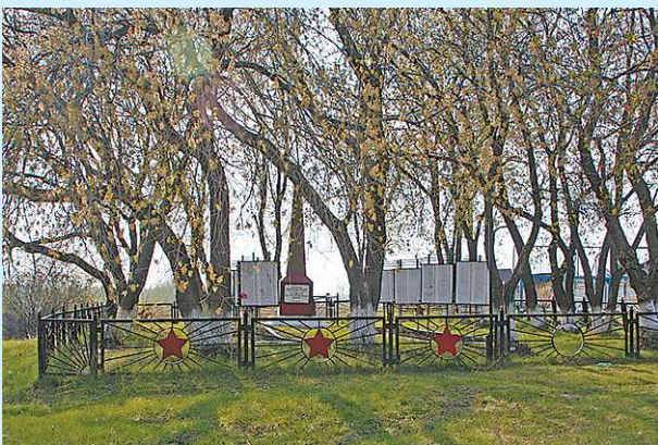
Это тот самый мемориал, посвящённый воинам-односельчанам, погибшим в годы Великой Отечественной войны.