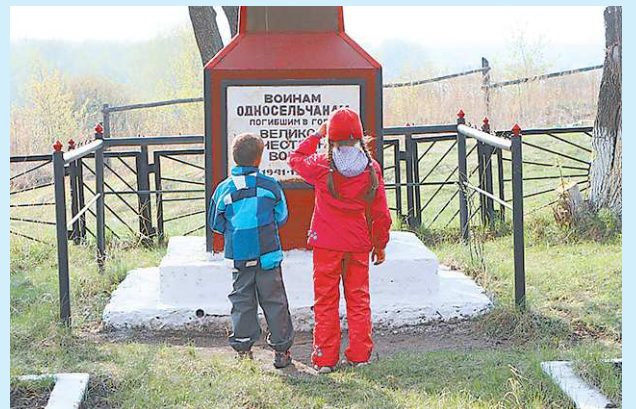
Благодаря заботе ребят, обелиск сохраняется в отличном состоянии. К нему приходят жители со всего села круглый год.