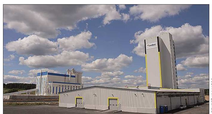
Предприятия, появившиеся на окраине Полевского, работают по самым современным технологиям.