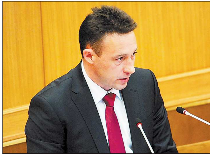
Игорь Холманских — полпред Президента, создавший своё политическое движение