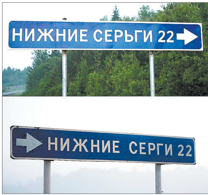
Кстати, от «знаковой» ошибки нередко страдает и нижнесергинский сосед - посёлок Верхние Серги. Правда, с дорожными указателями там пока всё в порядке