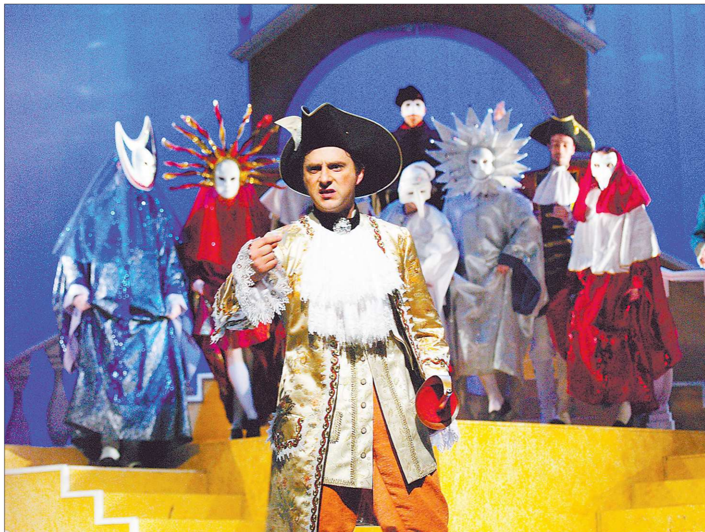
«Венецианские близнецы» – первый спектакль, появившийся в театре после шумного ухода Юрия Любимова. Но Любимов в спектакле есть. Константин. В одной из ролей