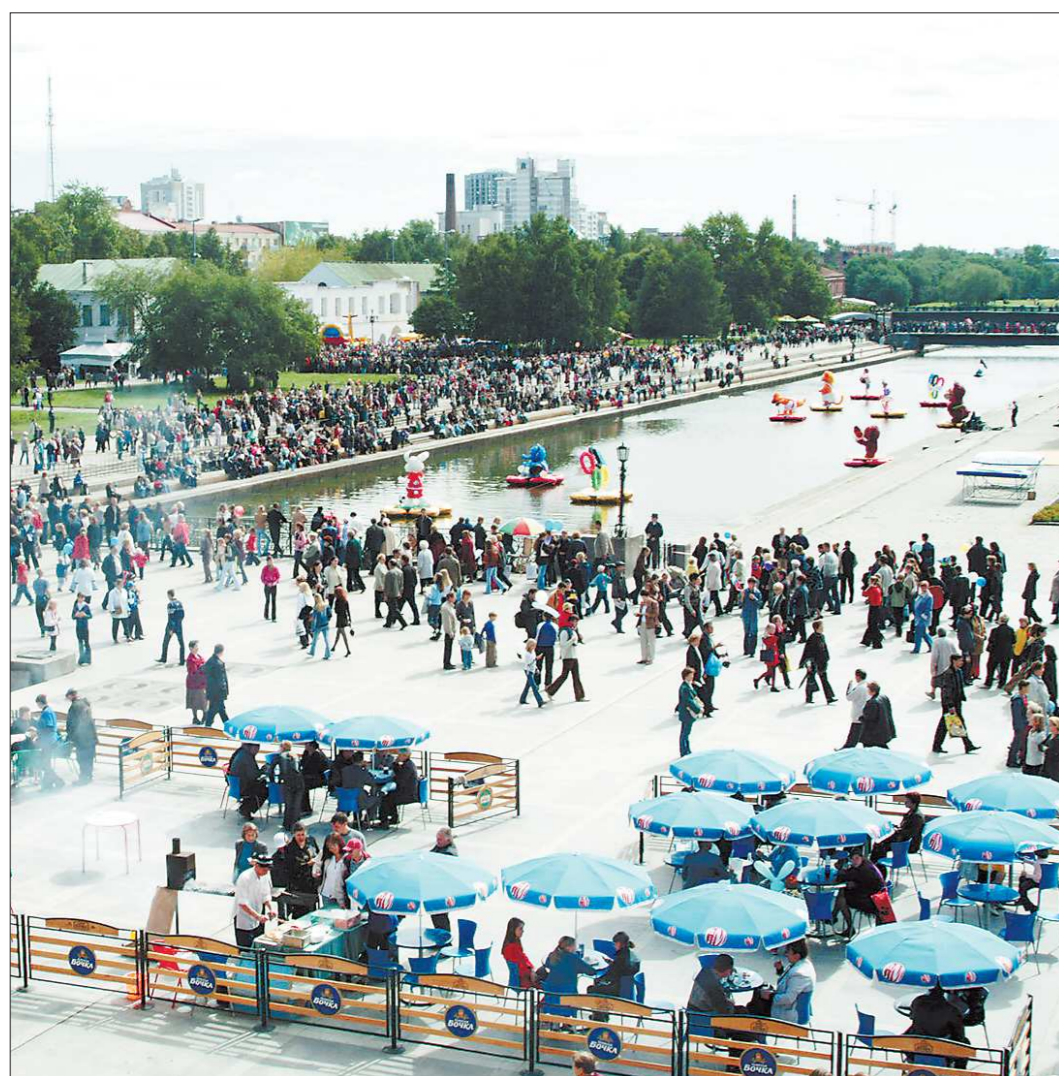
Летние кафе стали привычным атрибутом больших городов

Этим летом количество летних кафе и веранд в Екатеринбурге уменьшилось более чем в три раза. Недостаток таких заведений особенно заметен в жаркие дни: там, где в былые годы стояли уютные столики под шатрами, сегодня зачастую можно обнаружить лишь раскисшие на солнце асфальт и брусья.