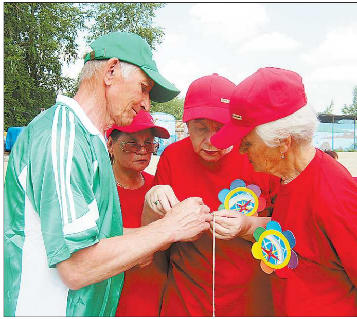
Мужчины из команды Железнодорожного района помогали женщинам из команды Кировского находить по компасу азимут