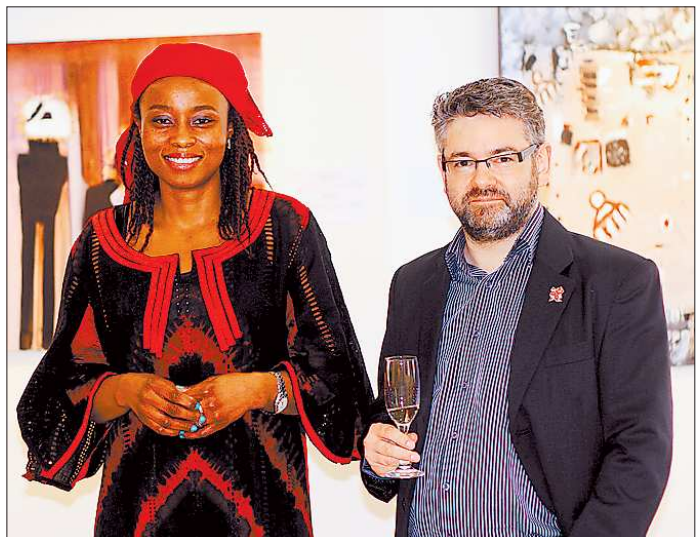
В свой портрет Чинви плеснула юмора. В портреты мужа — никогда