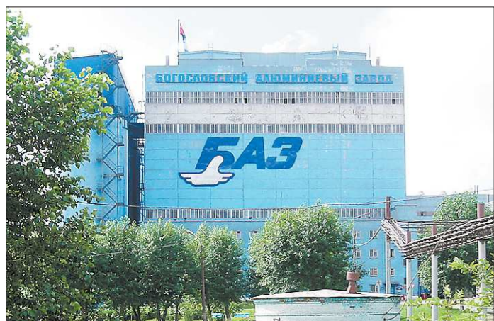
Благополучие Краснотурьинска зависит от положения дел на БАЗе

№ 228-229 (6284-6285). Цена в розницу — свободная.