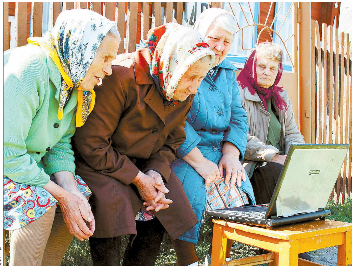
Ради компьютерной грамоты свердловские пенсионеры даже сады и огороды на задний план отодвинули

В целом, шансы учиться за казенный счёт у абитуриентов всё ещё остаются. Но не исключено, что вскоре претендовать на бюджет смогут ребята лишь с инженерным складом ума, а родителям гуманитариев придётся подкапывать деньги – учить их ребёнка бесплатно государство, как видишь, не заинтересовано.