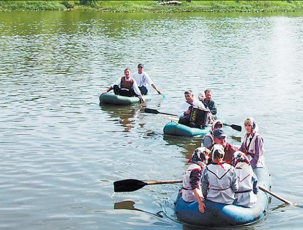
Предки нынешних мари прибыли на Средний Урал по воде. Устроители Праздника плуга решили показать гостям, как примерно это было