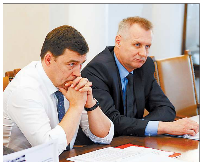
Руководство области и «Русала» ведут напряженный диалог по поводу дальнейшей судьбы БАЗа

(Комментарий «ОГ»: Если такого понимания сознательные граждане не проявят, то, по-видимому, они могут обратиться с заявлениями в суд по поводу нарушения тишины после 23.00. Могут, но лучше все же немного потерпеть. Даже если у вас нет своей машины: общественному транспорту тоже ведь нужны хорошие дороги, а раз ночью ремонт делать быстрее и качественнее, то стоит, наверное, смириться с возможными неудобствами. Чем скорее сделаны работы ночью, тем меньше будет загортов на городских дорогах днём. Поскольку хотя бы одной причиной для загортов станет меньше.